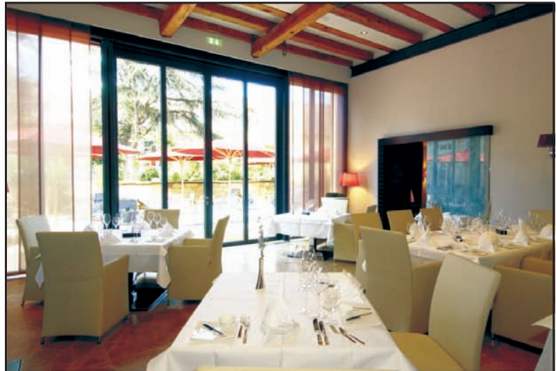
Modern designte, großzügige Räumlichkeiten: Gourmetrestaurant Freundstück

senaustrern und La Ratte Kartoffeln — alles geschmacklich und qualitativ comme il faut, herzlich harmonisierend untermalt von einem milden Chorizoschaum. Ein rundum „leckerer“ Knaller dann das feinsinnig abgeschmeckte Rindertatar mit Sauce gribiche als fettes, feinsäuerliches Unterfutter und einem saftig-schmorwürzigen Ochsen-schwanzraviolo mit bester, punktgenau reduzierter Kalbsjus.