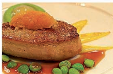
Gebratene Entenleber mit Erbsen; Rotbarbe mit Pulpo, Schinken und Gemüse.

>> Ketschauer Hof, Ketschauerhofstr. 1, Deidesheim, Tel. (0 63 26) 7 00 00; www.ketschauer-hof.com